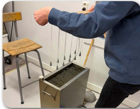
Ljusstöpning på Hembygdsgården

Vi blev även i år inbjudna till ljusstöpning på Hembygdsgården och barnen tycker det är så roligt!