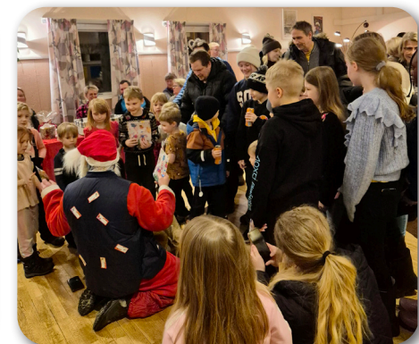
Många barn som ville träffa tomten