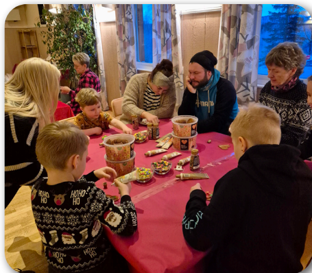
Dekoration av pepparkakor

Vi hade väldigt många besökare under dagen och vi vill rikta ett STORT TACK till alla som deltog! Vad tror ni om en repris nästa år?