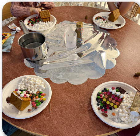
Dekoration av pepparkakshus

Livs Nära Dej har skänkt pepparkakshus till skolan som barnen fick dekorera och ställa ut på julmarknaden på Folkets Hus. Där utfördes även terminens goda gärning och skolan hade en loppis för att samla ihop pengar till barnen i Gaza, stort tack till alla som skänkt grejer till loppisen! Och såklart tack till alla som köpt och bidragit med en slant!