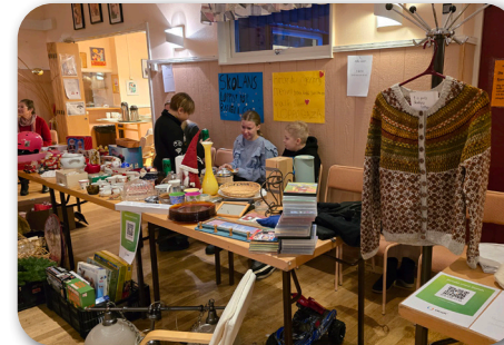
Loppis för barnen i Gaza

Personal från Gällivare Kyrka har varit till skolan och haft ett Bibeläventyr för barnen och skolan har även åkt in till Gällivare Kyrka för en julvandring, mycket roligt och uppskattat!