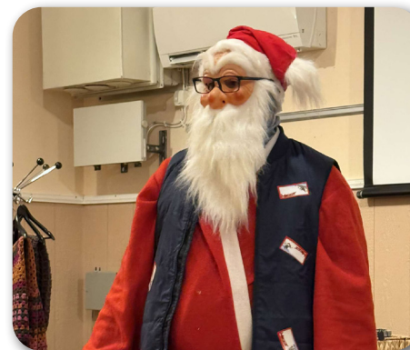
Tomten kom på besök!