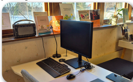
Digitala noden i Skaulo

Den digitala noden är en kontorsplats med WiFi som kan bokas kostnadsfritt på Servicekontoret i Skaulo. Här kan du tex sitta och jobba, delta på digitala möten, betala räkningar eller surfa på internet. Passa på om du behöver jobba på distans!