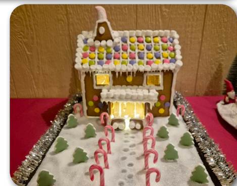
Malte Svalkvists pepparkakshus