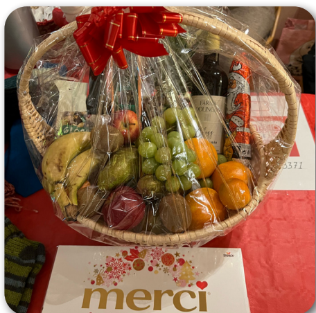
En av lotterivinsterna

Till pepparkakshustävlingen fick vi in 4 stycken fantastiska bidrag! Under dagen fick besökarna rösta på vilket bidrag de tyckte var finast. Två av bidragen hamnade på delad förstaplats och fick varsitt fint pris. Stort grattis till vinnarna!