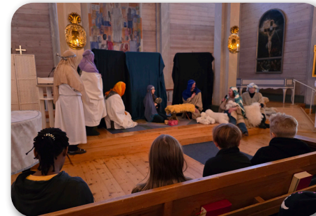
Eleverna på besök i Gällivare Kyrka

Personal från Gällivare Kyrka har varit till skolan och haft ett Bibeläventyr för barnen och skolan har även åkt in till Gällivare Kyrka för en julvandring, mycket roligt och uppskattat!