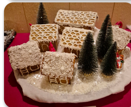
My Nordgrens pepparkaksby